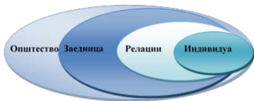
Слика 1. Еколошки модел за разбирање на насилството (превземено од Krug et al., 2002)

Изложеноста на различни видови на злоупотреба и занемарување и други негативни искуства во детството во дисфункционалните семејства (живење со член од семејството кој употребува алкохол, дрога, член од семејството кој бил во затвор, или ментално болен), исто така може да имаат влијание врз децата и нивниот понатамошен живот (Butchart et al., 2006; Sethi et al., 2013).