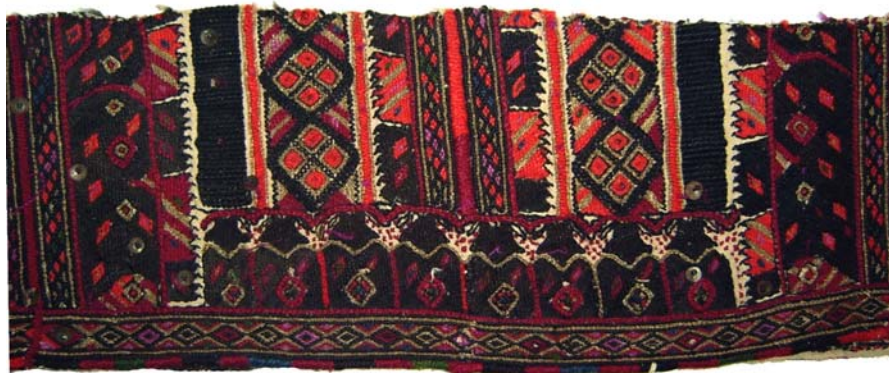
Сл.1. Долница од невестинска кошула - Гувелница , Скопска Блатија, Македонија, АИФ инв. бр. 178