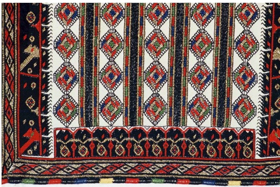
Сл.2. Вез од долница на невестинска кошула - Гувелница , Скопска Црна Гора, Македонија, АИФ, инв. бр. 825