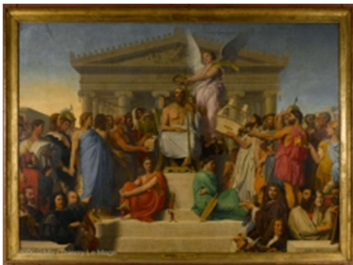
Слика 2: Енгр. Жан Август Доминик. „Боготворењето на Хомер или Хомерова Апотеоза“. 3.86 x 5.12 Лувр, Париз. http://www.louvre.fr/en/mediainages/homere-deifie-dit-aussi-l-apotheose-d-homere Посетено на 27.12.2016