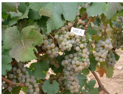
Сл. 1 Бела винска хибридна сорта Мила

година, автори се Петар Циндриќ, Љ. Јазик, Надежда Рузиќ, Н. Вукмировиќ. Злата е многу бујна со многу долги и неуреден пораст на ластари. Гроздот е голем (210-230g), средно растресит поставен на долга дршка. Зрната се средно големи, округли, со темно жолта боја, на сонце со рѓаста нијасна. Рано ја започнува вегетацијата и рано созрева I епоха. Има средна родност. Се одликува со висока отпорност на ниски зимски температури на почеток и средина на зимата, но отпорноста се смалува кон крајот на зимата. Има добра отпорност на сиво гниење и добра толеранција на пламеница, додека пак многу е осетлива на пепелница. Добро концентрира шеќери, но треба да се собере додека достигне 18%. Ако се собере подоцна вкупните киселини брзо опаѓаат. Виното добиено од оваа сорта е со неутрална арома, питко и со нешто помал квалитет. Најзначајна карактеристика на оваа сорта е раното созревање (Korać, Cindrić, 1999).