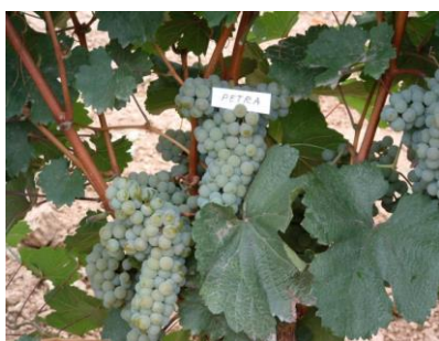
Сл. 3 Бела винска хибридна сорта Петра