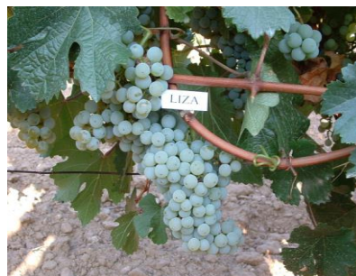
Сл. 2 Бела винска хибридна сорта Лиза