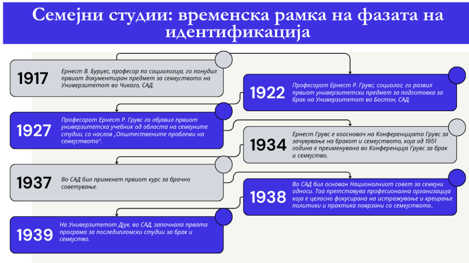
Слика 2: Семејни студии: фаза на отривање или идентификација