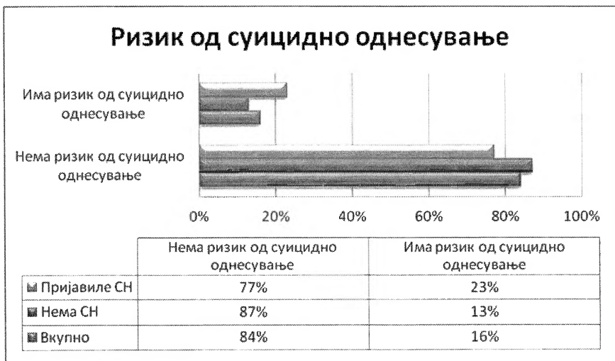
Графикон 3. Застапеност на постојење ризик од суицидно однесување

Теоретскиот минимален скор на скалата за мерење ризик од суицидно однесување изнесува 3, а максималниот скор изнесува 18. Во групата жени кои пријавиле семејно насилство, минималниот добиен скор изнесува 3, максималниот добиен скор е 16, а просечен скор на групата е 5,42. Во групата која не пријавила семејно насилство, минималниот скор е 3, максималниот е 10, а просечниот скор на групата е 4,10. Според процентуалната застапеност, кај групата која пријавила семејно насилство 23% од испитаничките имаат ризик од суицидно однесување, а кај групата која нема семејно насилство – 13% од испитаничките покажале ризик од суицидно однесување